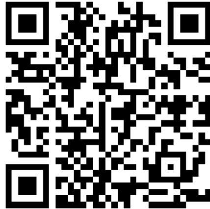
Sail Tracker Polar NMEA PRO(Android) letöltés